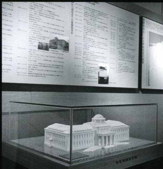
(財)斎藤報恩会の歴史コーナー

古生物(アロサウルスの骨格標本(複製))を中心として、宮城県産出の化石、鉱物、絶滅の恐れある鳥類の剥製をコンパクトに展示。また、(財)斎藤報恩会の85年の業績の中で特に優れた研究助成の成果である「八木・宇田アンテナ」など展示。