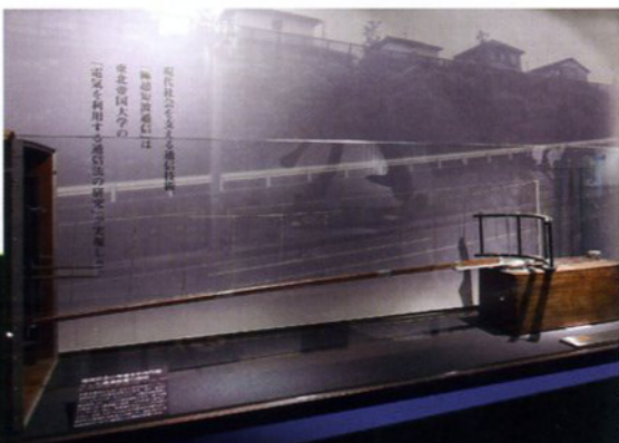
■八木・宇田アンテナ